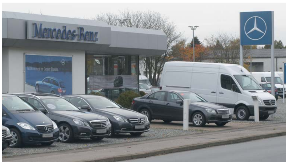
Ausstellungshalle und Fuhrpark