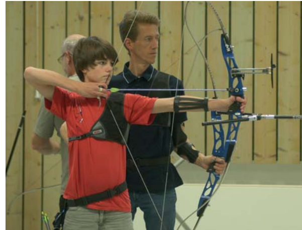
Jung und alt treffen sich zum Bogensport

ist. Im Winter nutzen die Triathleten zusätzlich das Husumer Hallenbad für ihr Training, Wasser-Gymnastik wird beim TSBW angeboten und die erwachsenen Handballer trainieren in den großen Husumer Schulsporthallen.