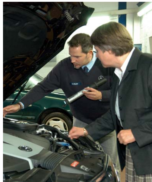
Dialogannahme – schnell & unkompliziert

Weitere Information finden Sie unter: www.nord-ostsee-automobile.de