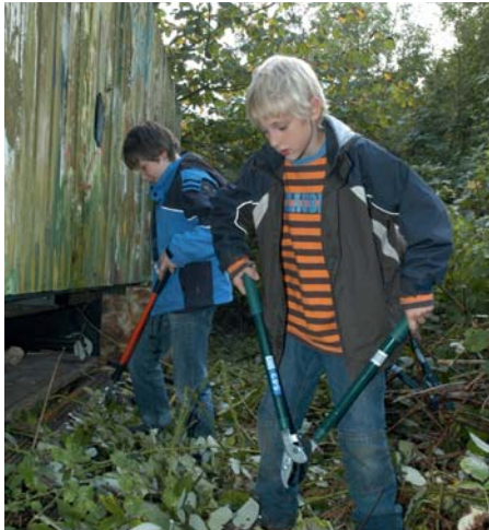
Im Pfadfinderland gibt es immer was zu tun