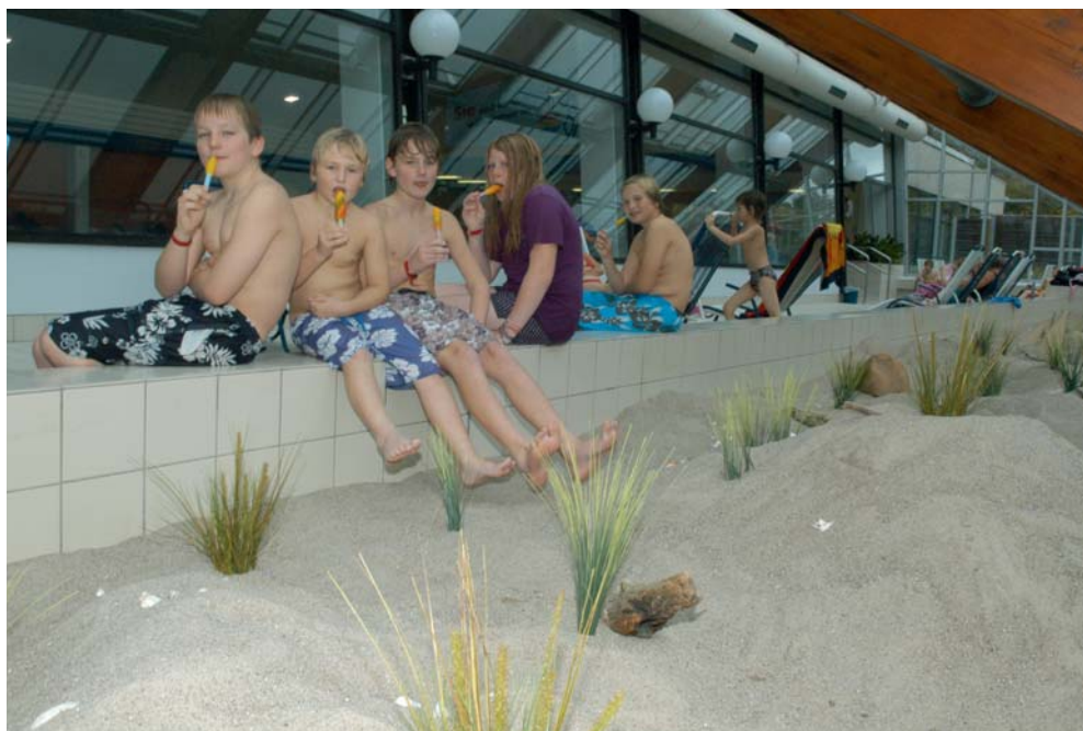
Die neue Dünenlandschaft lädt zum Entspannen ein