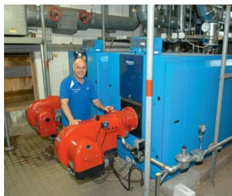
Mehr Effizienz durch neue Heizkessel

Was von außen wohl am auffälligsten ist: Die neue Schrankenanlage bei der Zufahrt zum Parkplatz und das knallige, frische Rot an der Außenwand. Insgesamt 750.000 Euro hat die Stadtwerke Husum GmbH als Eigentümerin investiert – und es hat sich gelohnt!