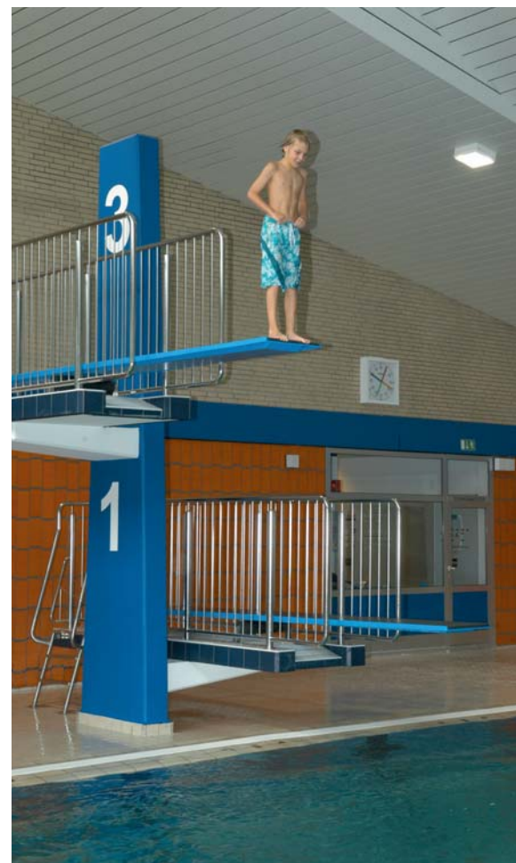
Das neue Geländer am Sprungturm sorgt für noch mehr Sicherheit

Viele Baumaßnahmen sind nicht zu sehen, so zum Beispiel die Sanierung der Stahlbetondecke oder der neue Heizkessel mit