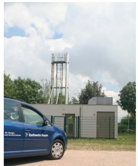
Das Blockkraftheizwerk in Mildstedt

Die Stadtwerke Husum beliefern seit dem 1. Juli 2010 alle Haushalts- und Kleingewerbekunden ohne Preisaufschlag mit 100%igem Naturstrom. Da ein wesentlicher Anteil der heute bereitgestellten erneuerbaren elektrischen Energie mittels Wasserkraft erzeugt wird, besteht das Produkt zu 2/3 aus Wasser- und zu 1/3 aus Windenergie. Dass der bereitgestellte Strom zu 100% aus erneuerbaren Ener-