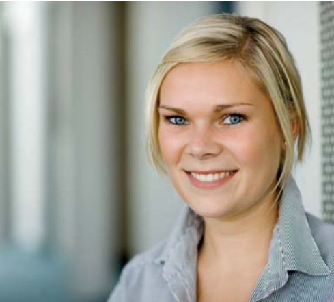
Persönliche Beratung ist bei den Stadtwerken Husum selbstverständlich

Die Stadtwerke Husum versorgen die Stadt Husum schon seit mehr als 100 Jahren zuverlässig mit Strom, Gas, Wasser und Wärme. Auch Mildstedt und Schobüll gehören zu unserem Versorgungsgebiet.